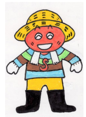
オリジナルキャラ ソーラー君

この本の中にこんな一節がありました。「土壌動物を繁殖させるには、日陰で湿った環境を作ってやらなければならない。・・・農民の目標は、森を肥沃にしている条件を農地に再現してやることである。農地を肥沃にするのは、土壌微生物の働きです。農薬でも化学肥料や有機肥料でもありません。できるだけ農地を森の状態に作り替える。難しいですが、私のテーマとなっています。土壌微生物を繁殖させるのに、日陰でしめった環境を作るソーラーシェアリングは最適だ、と意を強くしました。同書のご一読をお薦めします。