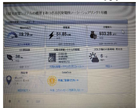
左：南側から見た農園 中：北側に設置した温度計 右：パソコン画面に送られてくるデータ